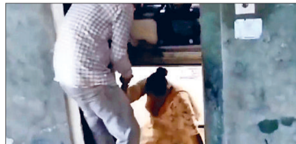
फतेहाबाद। महिला को लिफट से बाहर निकालते कर्मचारी।

फतेहाबाद के लघु सचिवालय में सोमवार को एक महिला की जान पर उस समय आफत आ गई, जब अचानक बत्ती गुल होने से महिला लिफट में फंस गई। घटना की सूचना मिलते ही सचिवालय में हड़कंप मच गया। कर्मचारी व सुरक्षाकर्मी मौके पर जुट गए और लिफट ऑपरेटर व तकनीकी स्टाफ को बुलाया गया। काफी प्रयासों के बाद मैनुअल तरीके से लिफट को नीचे लाया गया और महिला को सुरक्षित बाहर निकाला गया। लिफट से बाहर आते ही महिला बेहद घबराई हुई थी। उसे पानी पिलाया गया और कुछ देर