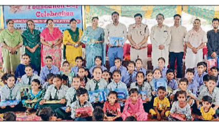
सिरसा। स्कूली बच्चों को स्टेशनरी वितरित करते हुए।