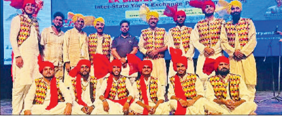
फतेहाबाद। इंटर स्टेट यूथ एक्सचेंज प्रोग्राम में प्रस्तुति देते एमएम कॉलेज के विद्यार्थी।

कुरुक्षेत्र यूनिवर्सिटी में हुए इंटर स्टेट यूथ एक्सचेंज प्रोग्राम में फतेहाबाद के मनोहर मेमोरियल कॉलेज के विद्यार्थियों ने हरियाणा राज्य का प्रतिनिधित्व करते हुए शानदार प्रस्तुति दी। हरियाणा प्रसूहान ‘सामन की झूल’ नामक प्रस्तुति ने कार्यक्रम में समां बांध दिया। इस राष्ट्रीय यूथ प्रोग्राम से लौटे विद्यार्थियों का आज कॉलेज पहुंचने