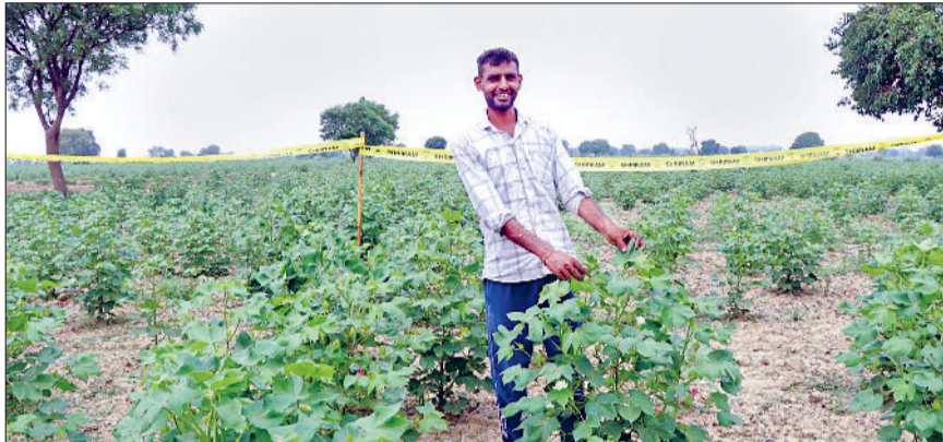
फतेहाबाद। बरसात न होने से सुखती नरमे की फसल।

आधे से ज्यादा सावन बीत चुका है। सावन के शुरूआत में अच्छी बारिश भी हो चुकी है लेकिन अब कई दिनों से बारिश नहीं होने के कारण भारी गर्मी का प्रकोप बना हुआ है। आसमान में सावन की काली घटाएं तो छा जाती हैं, परंतु बिना बरसे ही लौट जाती हैं। कहीं-कहीं होने वाली बूंदबांंदी उमस बढ़ाकर पसीना छुड़ाने का काम कर रही है। सप्ताह के शुरू में एक बार फिर झमाझम बारिश की संभावना जताई जा रही है। सोमवार को सुबह के समय आसमान में बादल छाए रहे। कुछ इलाकों में फुहार भी गिरी। बाद में आसमान साफ हो गया। दोपहर तक तेज धूप खिली रही, जिससे उमस भरी गर्मी ने लोगों को जमकर परेशान किया। अधिकतम तापमान 3 डिग्री सेल्सियस बढ़कर 36 डिग्री पर पहुंच गया। न्यूनतम तापमान भी इतनी ही दुर्द्ध के साथ 28 डिग्री सेल्सियस दर्ज किया गया। हवा में नमी का स्तर 68 प्रतिशत तक रहने के कारण वातावरण में नमी व