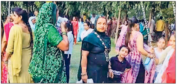
सिरसा। हरियाली तीज कार्यक्रम में झूला झूलती महिलाएं।

उमंग, उत्साह और फुल मस्ती। प्रतापगढ़ पार्क में हरियाली तीज के उत्सव पर यही सब दिखाई दे रहा था। हरजारों की संख्या में महिलाओं ने हरियाली तीज उत्सव में पहुंचकर कार्यक्रम को जीवंत बना दिया। पींग मटकाई, झूलो पर झूले लिए, डीजे पर डांस किया और तीज के पारंपरिक गीत गाकर पर्व की आभा को और अधिक शोभायमान कर