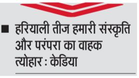
हरियाली तीज हमारी संस्कृति और परंपरा का वाहक त्योहार : केडिया

उमंग, उत्साह और फुल मस्ती। प्रतापगढ़ पार्क में हरियाली तीज के उत्सव पर यही सब दिखाई दे रहा था। हरजारों की संख्या में महिलाओं ने हरियाली तीज उत्सव में पहुंचकर कार्यक्रम को जीवंत बना दिया। पींग मटकाई, झूलो पर झूले लिए, डीजे पर डांस किया और तीज के पारंपरिक गीत गाकर पर्व की आभा को और अधिक शोभायमान कर