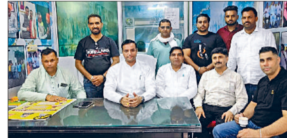
फतेहाबाद। पत्रकारों से बातचीत करते महाशक्ति चैरिटेबल ट्रस्ट के सदस्य।