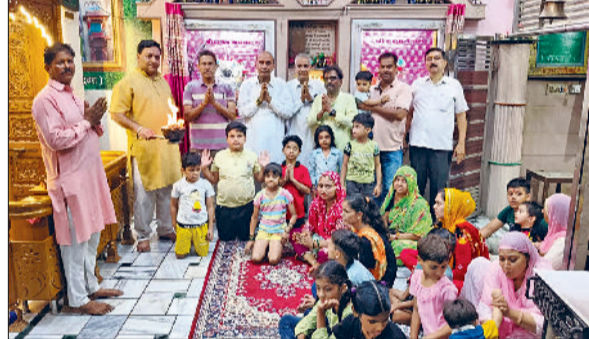
फतेहाबाद। प्राचीन बाबा रामदेव मंदिर रामदेवरा में पूजा अर्चना करते श्रद्धालु।

श्री बाबा रामदेव सेवा समिति की ओर से संचालित शक्ति नगर स्थित प्राचीन बाबा रामदेव मंदिर रामदेवरा में सावन माह की चांदनी दूज के उपलक्ष्य में बाबा रामदेव महाराज की पावन व सांची जोत प्रचलित की गई। जोत प्रचलित होते ही श्रद्धालुओं ने बाबा रामदेव महाराज की महिमा में जयकारें लगाकर आसपास के माहौल को भक्तिमय कर दिया। श्रद्धालुओं ने बाबा रामदेव महाराज के दरबार में नारियल ध्वजा चढ़ाकर मन्त्रों मांगी और संध्या आरती में शामिल हुए। समिति